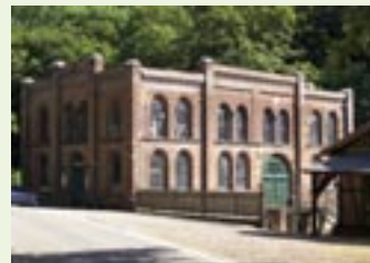
Das »Carlswerk« von außen und innen

Eintritt: € 2,00 pro Person Adresse: Degenershausen 8, 06543 Falkenstein/Harz Tel.: 034743 - 53681 Ansprechpartner: Frau Krosch