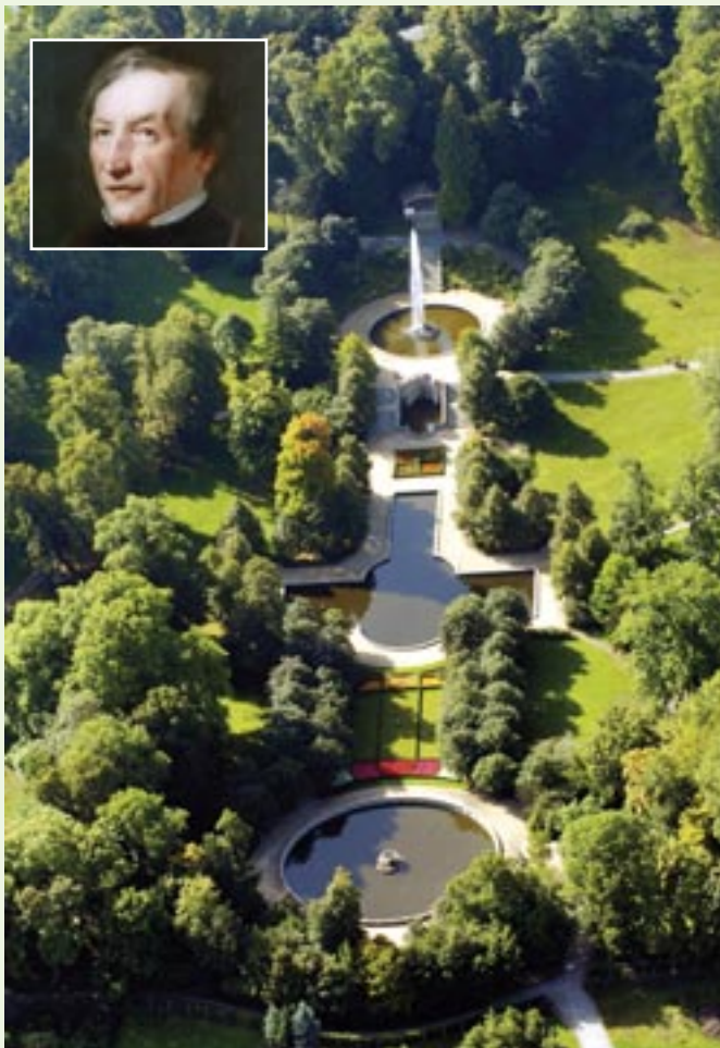
Schlosspark Ballenstedt, Peter Joseph Lenné

Eintritt: frei Adresse: Stadtgebiet Quedlinburg Ansprechpartner: Quedlinburg-Tourismus-Marketing GmbH, Markt 4, 06484 Quedlinburg / Tel.: 03946 - 905624